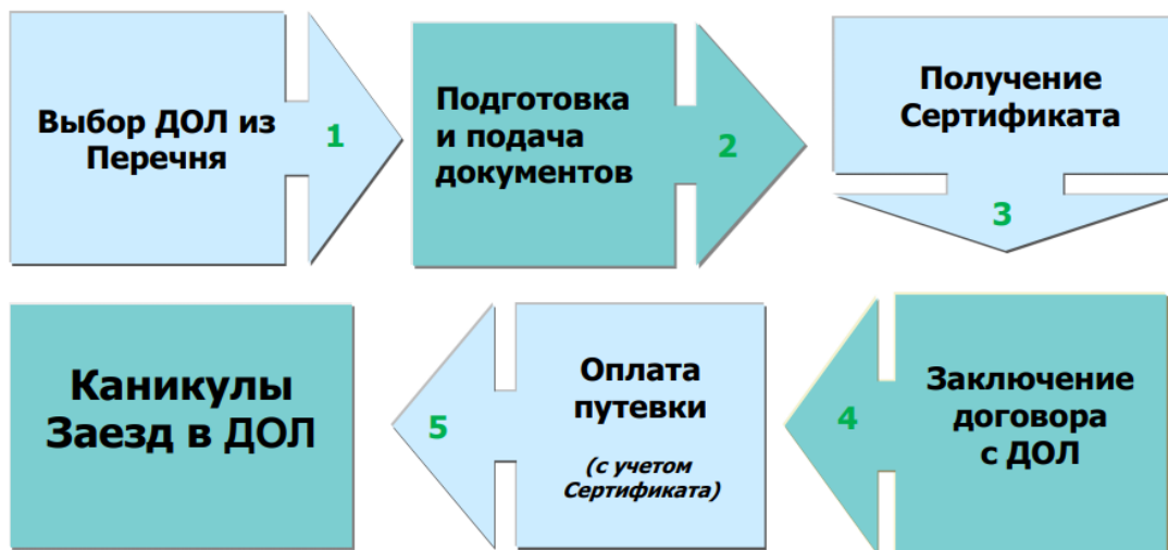
Рисунок 1. Порядок приобретения путевок в ДОЛ в Санкт-Петербурге.

Порядок приобретения путевок в детские оздоровительные лагеря (далее – ДОЛ) для детей работающих граждан представлен на рис. 1.